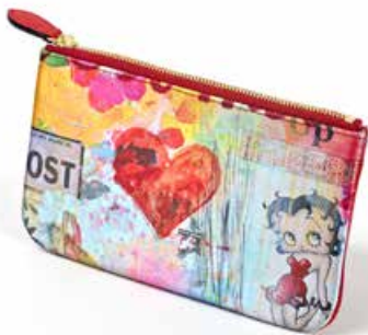
Petite trousse avec impression sur tissu d'une oeuvre de l'artiste espagnole Maria Burgaz (140 EUR).