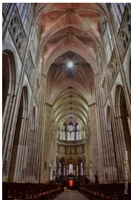
La très belle nef de la cathédrale.

développement de la rive droite. Au siècle dernier s'installèrent des banques tandis que l'architecture Art Déco déployait ses merveilles architecturales.