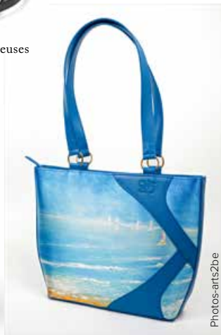
Sac à main Lucie en cuir bleu, oeuvre de l'artiste belge Anne-Marie Monin (1.250 EUR).