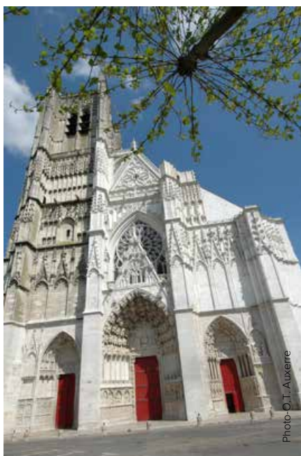
La cathédrale Saint-Etienne.