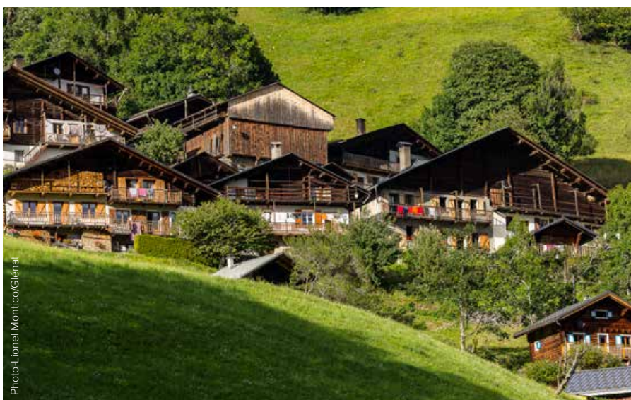
L'architecture traditionnelle savoyarde de Boudin.

Sur le sol français, l'arc alpin s'étend sur six départements : la Haute-Savoie, la Savoie, l'Isère, les Hautes-Alpes, les Alpes de Haute-Provence et les Alpes-Maritimes. Du lac Léman à la Méditerranée, les villages présentent des aspects qui se modifient en fonction du relief, bien sûr, mais aussi du climat. Par centaines, ils reflètent un mode de vie dicté par la nécessité de s'adapter au cadre naturel. L'habitat n'est d'ailleurs pas leur seule richesse patrimoniale : les Alpes sont constellées de très beaux édifices religieux et parsemées de fortifications particulièrement intéressantes.