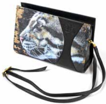
Les pochettes Zoé offrent de nombreuses possibilités (490 EUR).

Quelle que soit votre tenue, arts2be vous proposera toujours un accessoire coloré – et 100 % belge –, qui fera son petit effet : pochette, trousse ou sac vous raviront en toute occasion.