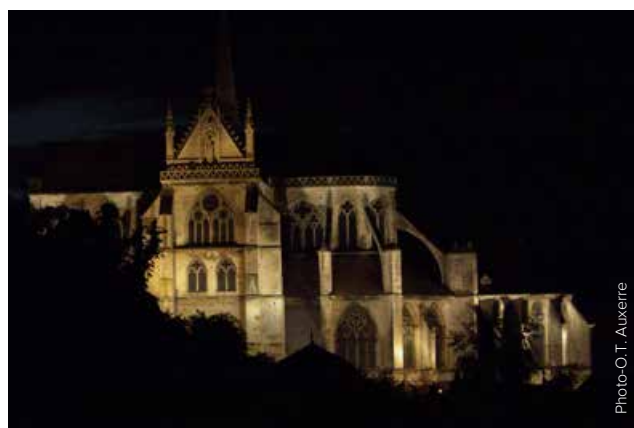
Lumières sur l'abbaye Saint-Germain.

L'abbaye offre un panorama architectural de premier plan : l'église abbatiale est de style gothique ; la salle du chapitre date du XII e siècle, tout comme la Tour de Saint-Jean dont l'imposante flèche de pierre à huit pans convexes surplombe l'ensemble des bâtiments ; le cellier est du XIV e ; enfin, le cloître, de style classique, a été reconstruit au XVII e . Une partie de l'abbaye abrite un musée : nous y reviendrons.