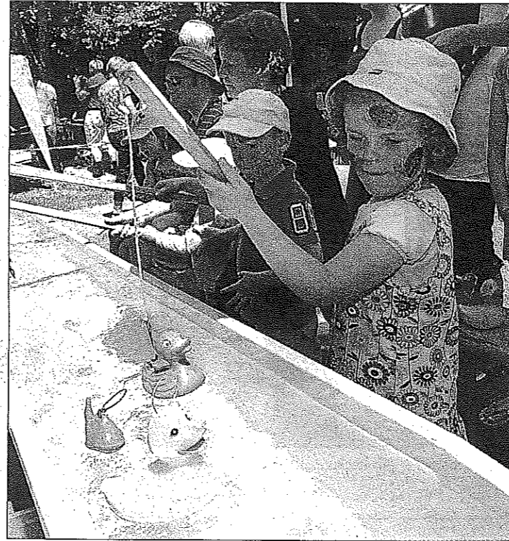
Für jede Altersgruppe gab es spannende Unterhaltung.

Um ihr traditionelles Familienfest so attraktiv wie möglich zu gestalten, hatten die Verantwortlichen keine Mühen gescheut, um ein unterhaltsames Rahmenprogramm für Besucher aller Alterskategorien auf die Beine zu stellen. Schon zum morgendlichen Feststart hatten die Schulkinder gemeinsam mit ihren Merscher Alterskollegen die Jahresab-