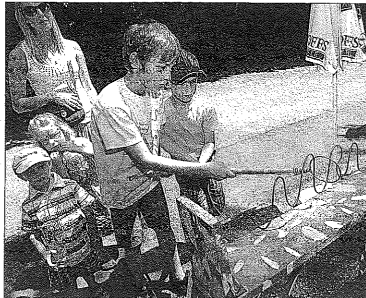
Geschicklichkeit war bei vielen Spielen gefragt.